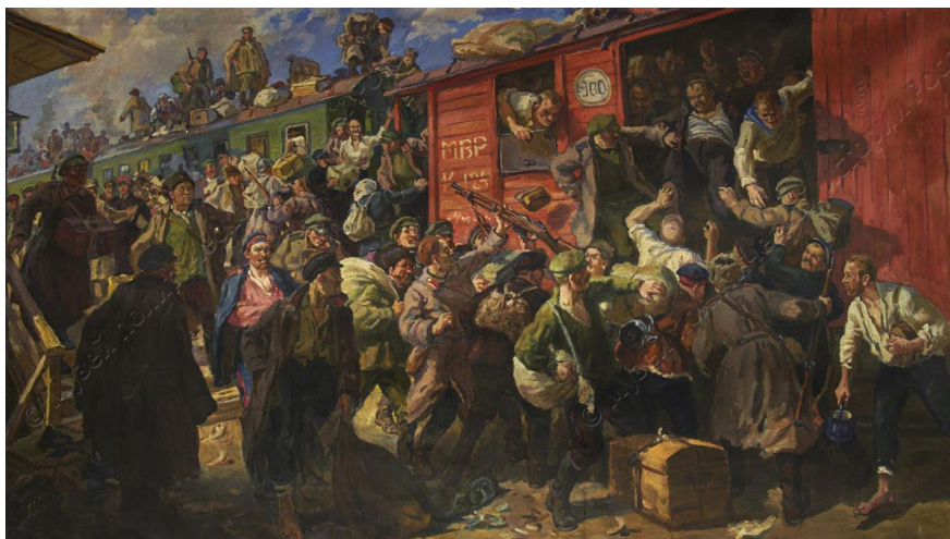
Рисунок 4. Савицкий Г. К. Стихийная демобилизация старой армии. ГМПИР. Ф. ИЗО и авторская графика. Ед. хр. Ф.IV-75.

пополняясь бывшими служащими 13-го Белозерского, 14-го Олонецкого, 15-го Шлиссельбургского и 16-го Ладожского пехотных полков., а также добровольцами, мобилизованными и пленными. Белозерский полк внес значительный вклад в штурм Чернигова, захватив множество военной добычи, в т.ч. несколько тысяч пленных. Но штурм Чернигова оказался последним победным делом полка. Вооруженные силы на Юге России стали преследовать неудачи, и полк отступил в Польшу, где был в лагерях вплоть до августа 1920 г., откуда остатки полка были переброшены через Румынию в Крым [26, с. 381].