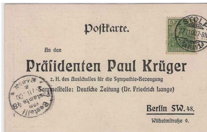
Рис 2. Немецкая почтовая открытка «Unser Mitgefühl dem treuen Vater seines Volkes», Берлин: Deutsche Zeitung, 1900 г. Источник: 1Почтовая открытка «Unser Mitgefühl dem treuen Vater seines Volkes» (Наше сочувствие верному отцу своего народа). Deutsche Zeitung. [Берлин], 1900. (Частное собрание).