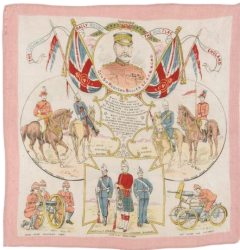
Рис 5. Памятный платок «The Colonies Rally Round the Old Flag of England». 1899 г. Источник: The Colonies Rally Round the Old Flag of England [Памятный платок]. [S.l.], 1899. Inv. No. NAM. 1961-12-676-1. // National Army Museum (London). URL: https://collection.nam.ac.uk/detail.php?acc=1961-12-676-1 (дата обращения: 07.08.2025).